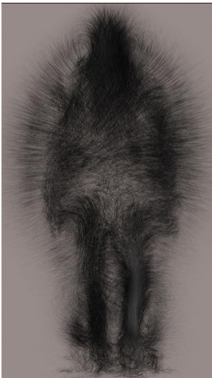
teamLab, Dissipative Figures – Human , 2022 Digital Work, Single channel, Continuous loop

9 Juni – 2 Juli, 2022 15-17 Quai des Bergues Genf